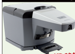
Sensor Cruiser VSR8000