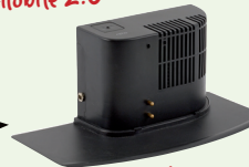
Robotic Vacuum Cleaner